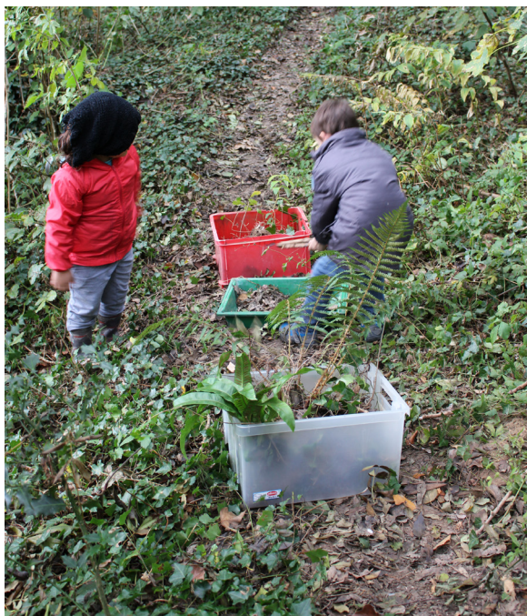
La collecte de petites bêtes et la récupération d'éléments naturels