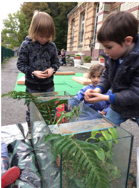
L'installation dans le terrarium