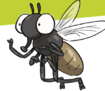
Imagène, la Mouche

Vous avez choisi de travailler sur les Diptères, autrement appelés « insectes à deux ailes ». Le scénario pédagogique proposé ici peut tout à fait être adapté à l'étude des mouches uniquement, ou celle des moustiques. Pour vous aider à traiter le sujet, nous vous informons qu'il existe un Cahier technique (CT66 « À la rencontre des Diptères » à retrouver sur fcfn.org ). Voici quelques pistes et fiches téléchargeables pour vous aider à construire votre projet.