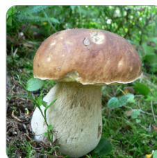
Cèpe de Bordeaux ( Boletus edulis )